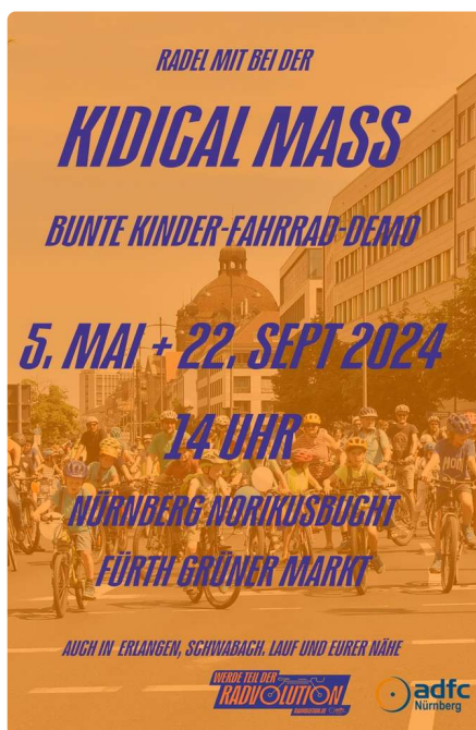
Kidical Mass am 5. Mai

Der Diakonieverein hat keine Personalkosten und keine Aufwandserschädigungen zu bestreiten, sondern wird überwiegend durch ehrenamtliches Engagement und das Pfarramt St. Martin geführt. So kommt jede Spende und jeder Mitgliedsbeitrag direkt dort an, wofür die Hilfe gedacht ist.