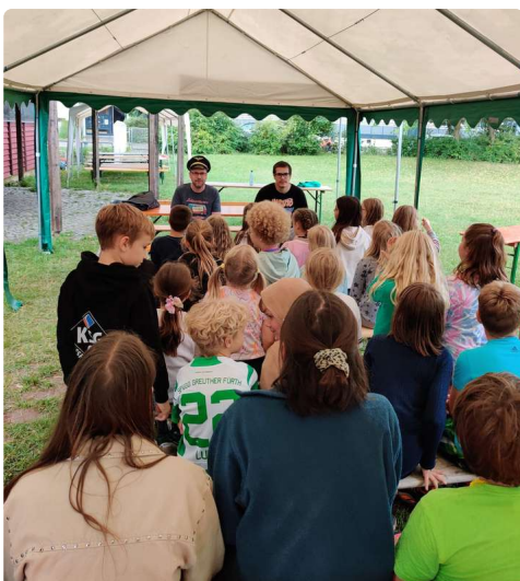
Kinderaktionswochen in Aktion

In Kooperation mit der EJ Fürth und der Diakonie Fürth kommen in den ersten beiden Ferienwochen jeweils rund 40 Kinder in unserem Gemeindehaus im Finkenschlag zusammen. Zu den Themen „Tierisch gut drauf“ und „Ritter, Burgen und Spektakel“ gibt es auch dieses Jahr viel zu erleben.