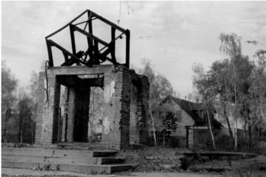
Bild der zerstörten Martinskapelle