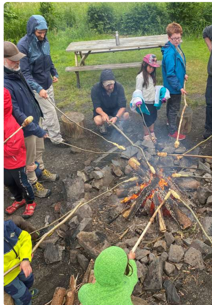
Lagerfeuer und Gespräche

Kommen Sie einfach vorbei und genießen Sie die Atmosphäre in unserer Martinskirche.